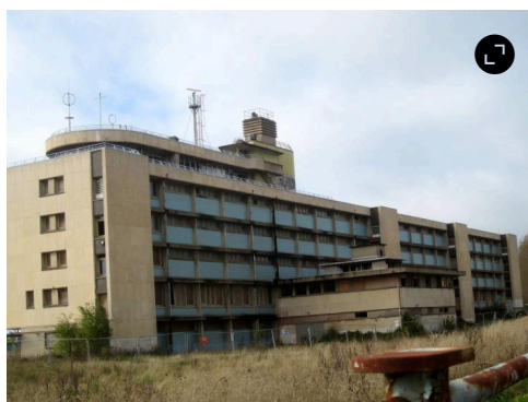
L'ancienne école de la Marine marchande est encore régulièrement vandalisée

Au rappel du nombre de 310 futurs logements, « plus petits mais un peu plus nombreux », le public réagit : « Qui dit plus de logements dit plus de circulation ! » L'adjoint au maire se veut rassurant : « Des aménagements sont prévus, un giratoire, un barreau au niveau du stade, une circulation apaisée rue Boissaye-du-Bocage et route du Cap, un bus reliant directement La Hève à la plage permettant de rejoindre le tramway ».